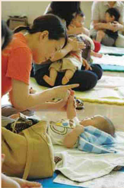
●平成18年 ベビーマッサージ