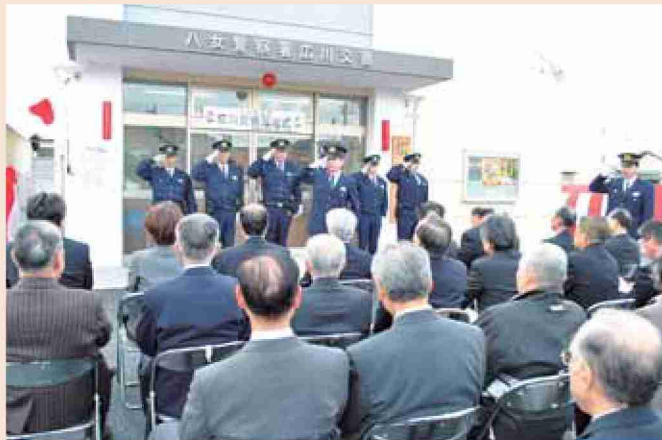
●平成24年 広川交番落成式