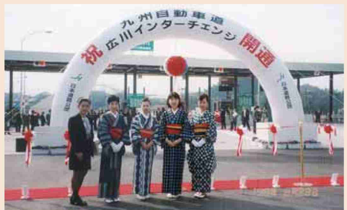
●平成10年 広川インターチェンジ開通式