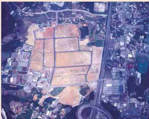
●平成17年 久留米・広川新産業団地竣工(空撮)