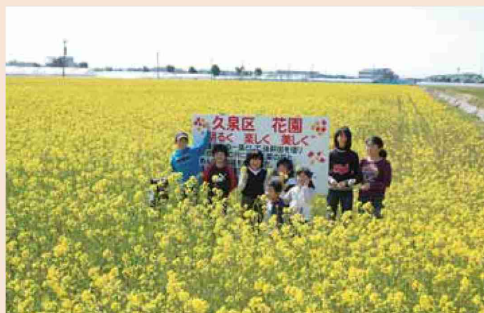
●平成19年 久留米菜の花畑