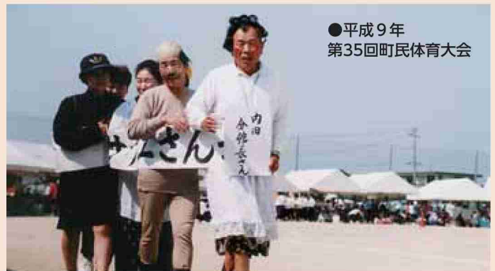
●平成9年 第35回町民体育大会