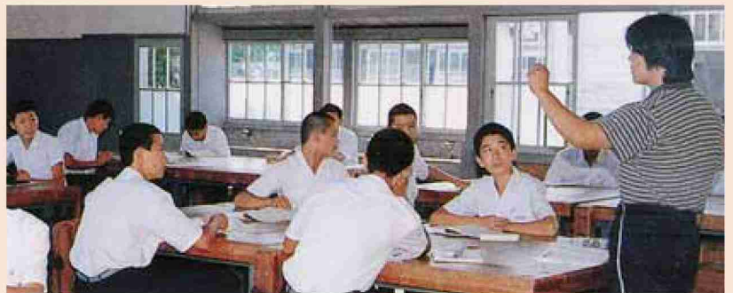
●昭和60年代 広川中学校授業風景