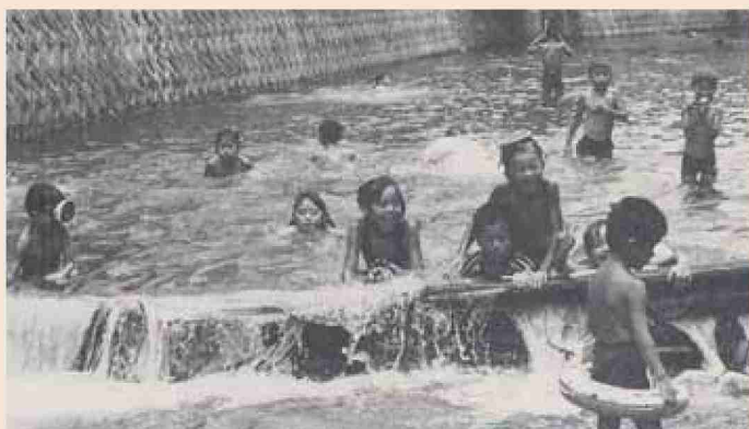
●昭和63年 梯区子ども会 丸太で川をせき止めて天然のプールに

ふるさと創生事業で小学生が 郷土を愛する心を育むことを目的に ヘリコプターに乗って町を観察