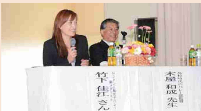
●平成24年 竹下選手来町「持とう私の夢」講演会