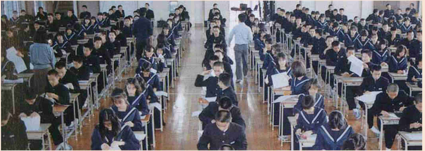
●昭和60年代 広川中学校テスト風景