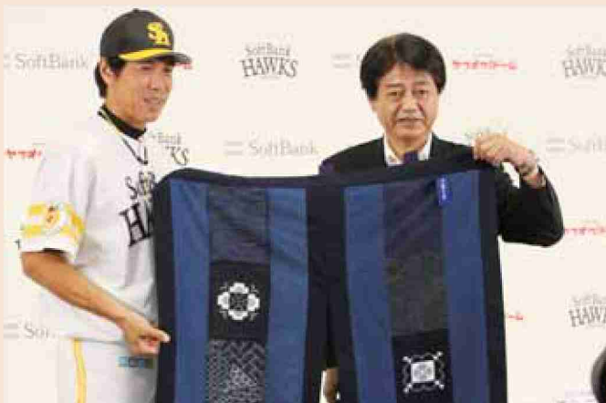
●平成26年 ソフトバンクホークスと地域連携協定を締結