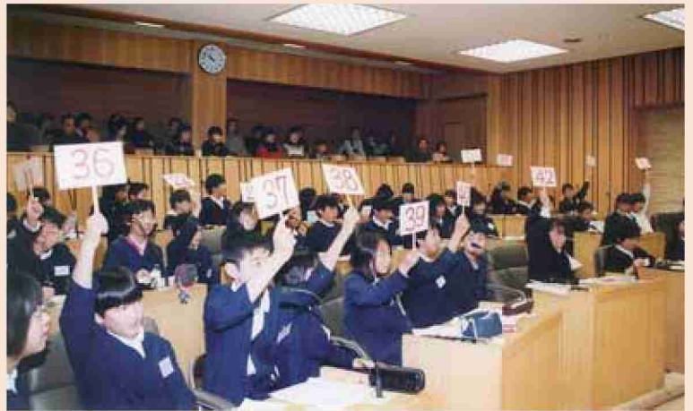
●平成13年 子ども議会