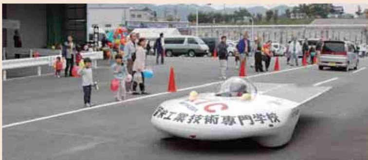
●平成17年 第1回ひろかわ環境フェア