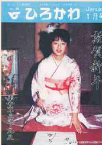
●昭和63年 広報表紙から ミスかすりの 書き初め