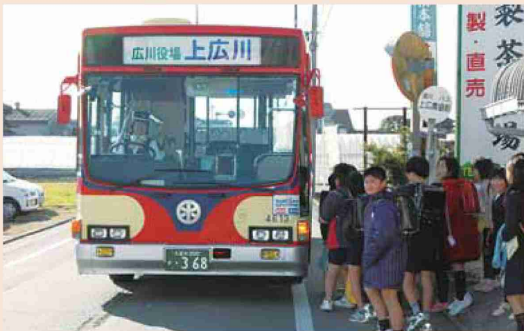
●平成19年 堀川バス通学風景（上広川小学校）