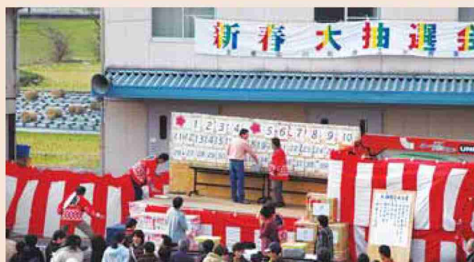
●平成19年 商工会大抽選会