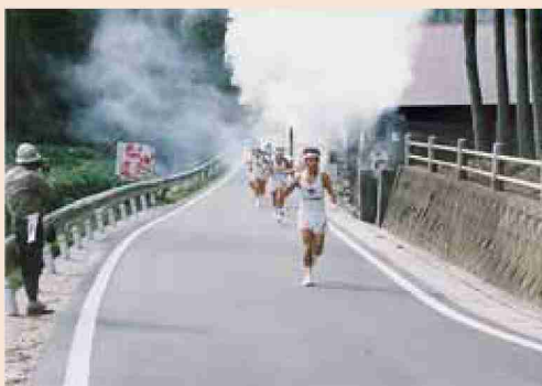
●平成2年 とびうめ国体 炬火、広川路を走る