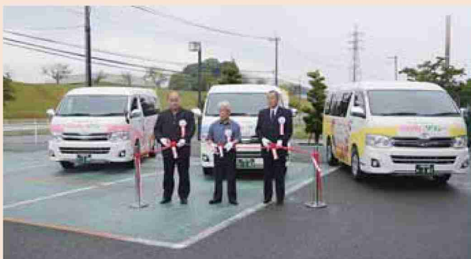
●平成25年 ふれあいタクシーオープニングセレモニー