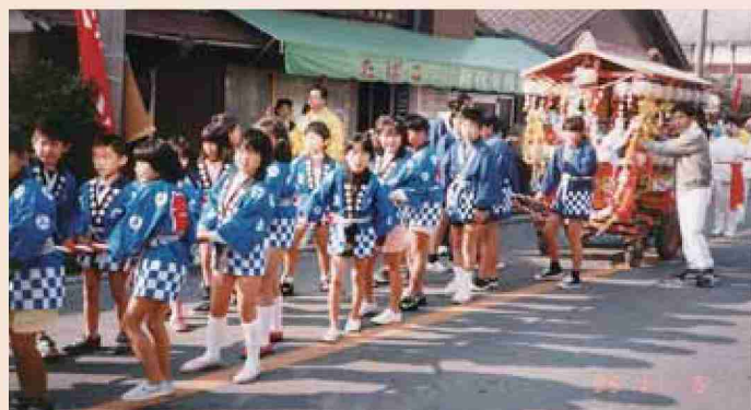
●平成7年 広川まつりパレード（増永神輿）