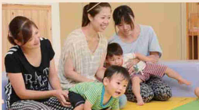
●平成26年 いこっくに移転後のハグハグ