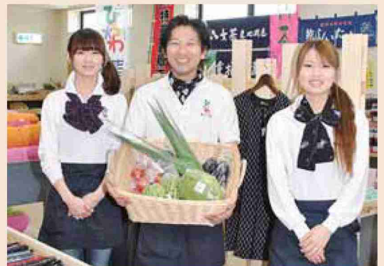
●平成23年 藍彩市場オープン