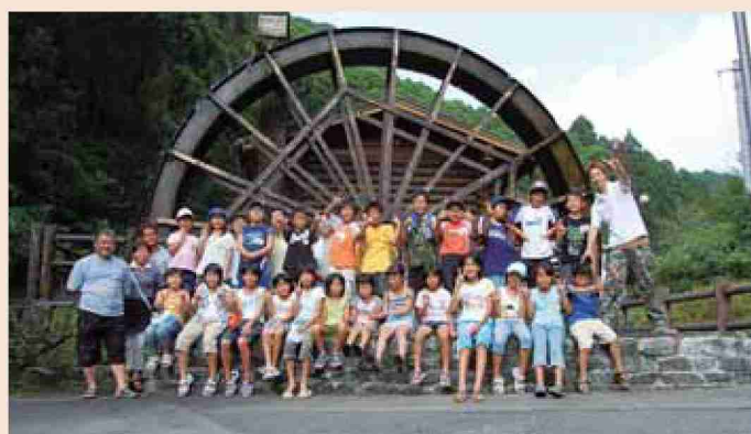
●平成18年 ゴットン里山体験塾