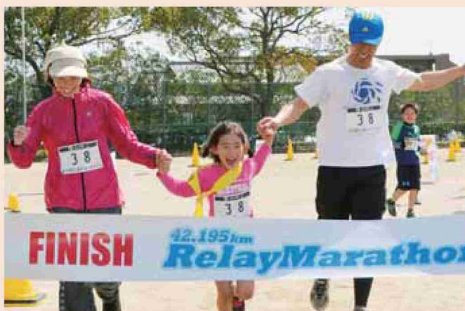
●平成26年 第1回広川町42.195 Km リレーマラソン大会開催