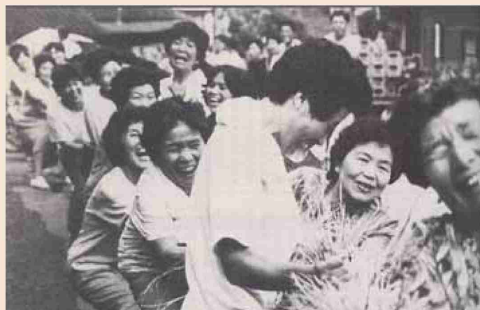
●平成元年 逆瀬盆綱引き、約300人参加！