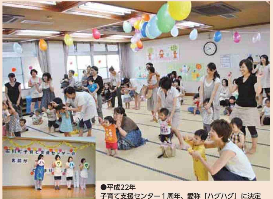
●平成22年 子育て支援センター1周年、愛称「ハグハグ」に決定