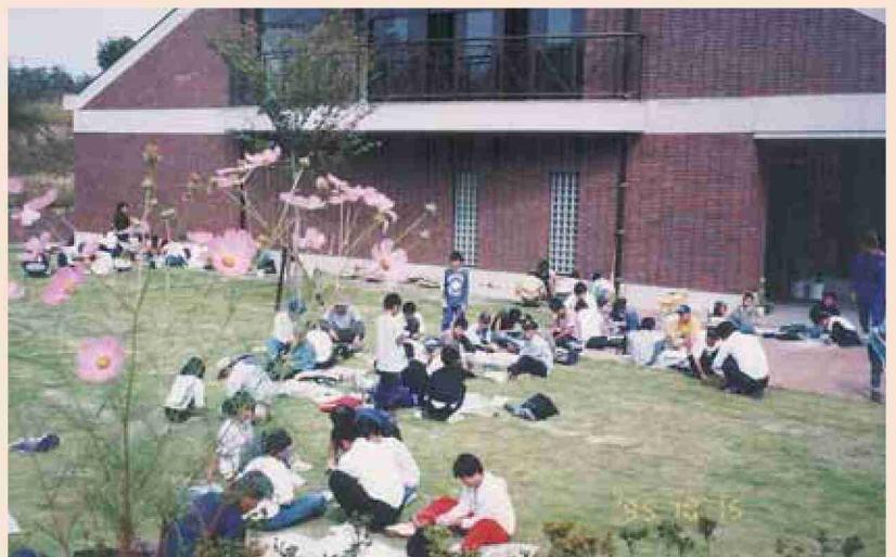
●平成7年 古墳公園資料館が完成し、八女地区の子どもたちと勾玉作り