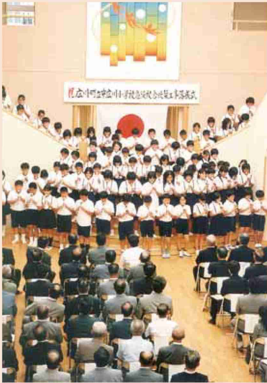
●平成14年 広川町立中広川小学校危険校舎改築工事落成式