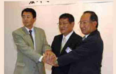
●平成16年 合併協議会