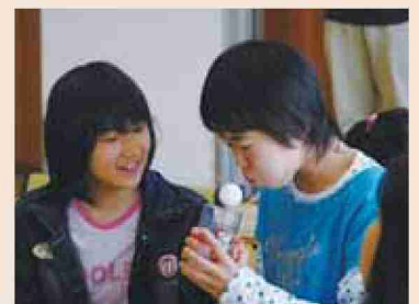
●平成18年 理科大好き塾