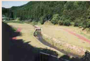
●平成16年 広川ダム公園完成