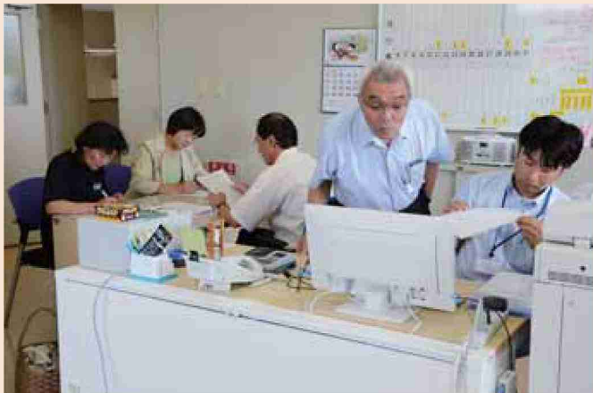
●平成24年 ボランティア活動センター開設