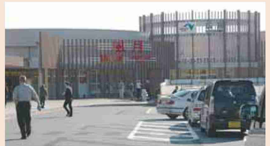
●平成20年 広川S Aリニューアルオープン