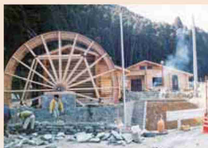
●平成7年 ゴットン館建設中