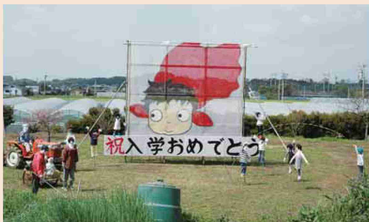
●平成21年 新入生をお祝いするかし（太原区）