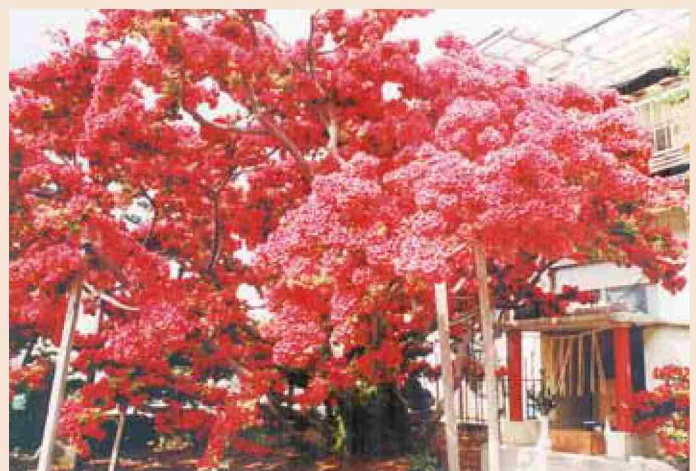
●平成12年 キリシマツツジ