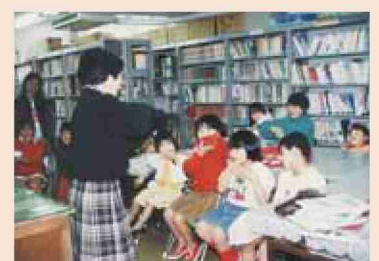
●平成4年 図書室で読み聞かせ・手遊び