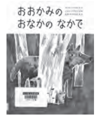
おおかみの おなかのなかで マック・バーネット / 文 徳間書店