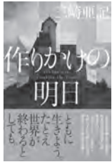
作りかけの明日 三崎亜記 / 著 祥伝社