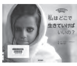
私はどこで 生きていけばいいの? ローズマリー・マカーニー / 文 西村書店東京出版編集部