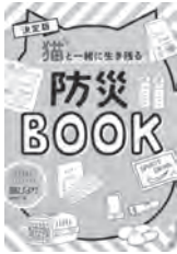
決定版猫と一緒に生き残る 防災 BOOK 猫びより編集部 / 編 日東書院本社