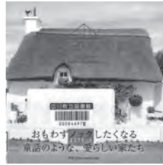
世界のかわいい家 バイインターナショナル / 編著 バイインターナショナル