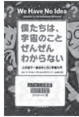
僕たちは、宇宙のこと ぜんぜんわからない ジョージ・チャム / 著 ダイヤモンド社