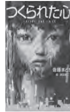
つくられた心 佐藤まどか / 作 ポプラ社