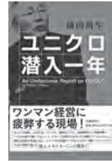
ユニクロ 潜入一年 横田増生 / 著 文藝春秋