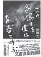
この高鳴りを僕は青春と呼ぶ 坂田光 / 著 ヨシモトブックス