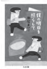
僕の明日を照らして 瀬尾まいこ / 著 筑摩書房