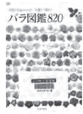
パラ図鑑 820 主婦の友社 / 編 主婦の友社