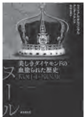
コ・イ・ヌール ウィリアム・ダルリンブル / 著 東京創元社