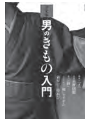
男のきもの入門 世界文化社