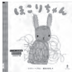
ほこりちゃん エイミー・ヘブロン / 作 あすなろ書房