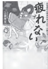
疲れない大百科 工藤孝文 / 著 ワニブックス