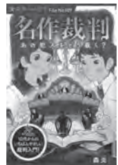
名作裁判 あの犯人をどう裁く? 森炎 / 著 ポプラ社