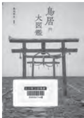
鳥居大図鑑 藤本頼生 / 編著 グラフィック社