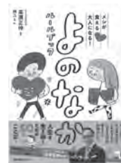
メシが食える大人になる! よのなかルールブック 高濱正伸 / 監修 日本図書センター