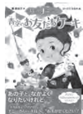
まじよのナニーさん 青空のお友だちケーキ 藤真知子 / 作 ポプラ社