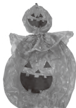
ハロウィン衣装の一例