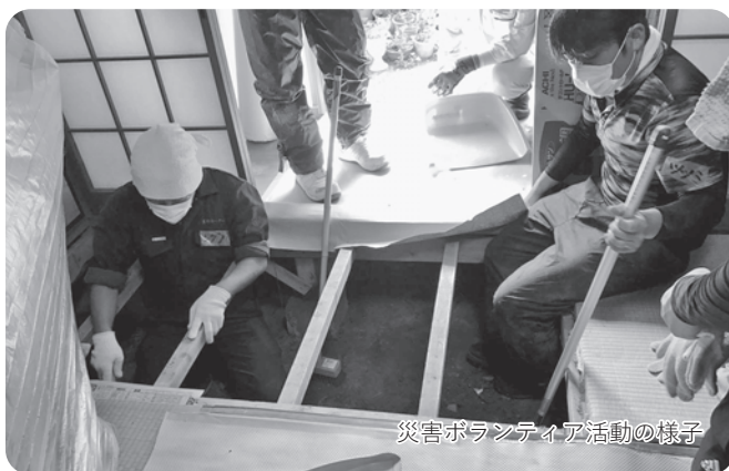
災害ボランティア活動の様子

次回（2020年12月号）は…… ボランティア活動の4原則の一つ「自主性・主体性」とは