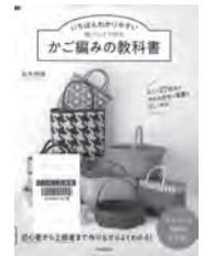
いちばんわかりやすい紙バンドで作るかご編みの教科書 古木明美 / 著 河出書房新社