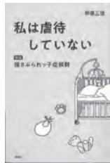
私は虐待していない 柳原三佳 / 著 講談社