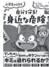
自分を守る!身近な危険 舟生岳夫 / 監修 小学館