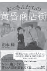
おっさんたちの黄昏商店街 もう一度、キミのとなりで。 池永陽 / 著 潮出版社