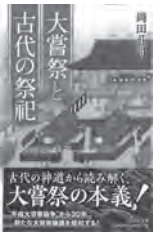
大嘗祭と古代の祭祀 岡田莊司 / 著 吉川弘文館