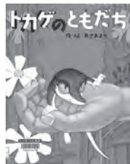
トカゲのともだち あさよう / 作・絵 フレーベル館