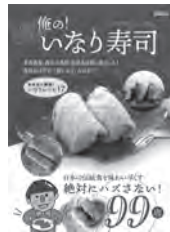
俺の!いなり寿司 いなり王子 / 監修 徳間書店