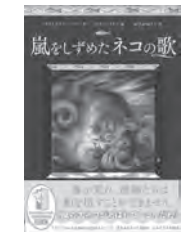
嵐をしずめたネコの歌 アントニア・バーバー / 作 徳間書店