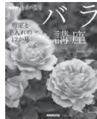
バラ講座 NHK 出版 / 編 NHK 出版