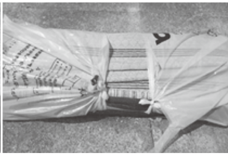
町指定ごみ袋に入りきれしていないごみ

最近ごみ集積場で、町指定ごみ袋に折りたたまれた布団や毛布・じゆうたんが入っていたり、ごみ袋にごみが入りきれいでなかったりする場合が多く見られます。このようなものは、可燃ごみとして収集することができません。