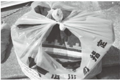
町指定ごみ袋に入れられた布団