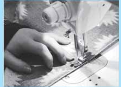
▼Kibiru プレオープンの様子