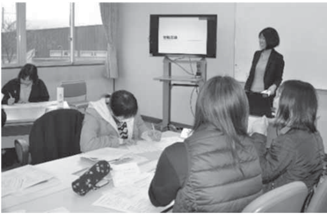
▲施設職員向けボランティア受け入れ講座

ンティアが相互に良い関係を築き、有意義な活動を進めるために「受け入れる側の心得」を学びました。