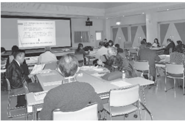
▲登録団体更新説明会・情報交換会

後半の情報交換会では、各施設でのボランティア受け入れ状況や、受け入れるときの悩み、ボランティアを募集するときの工夫点など、具体的な意見が交わされました。