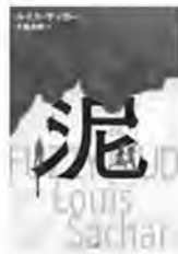
泥 ルイス・サッカー/作 小学館