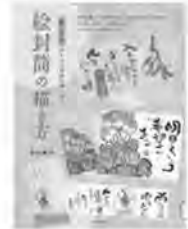
絵封筒の描き方 吉水咲子/著 誠文堂新光社