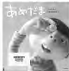
あめだま ベクヒナ/作 ブロンズ新社