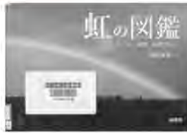
虹の図鑑 武田康男/文・写真 緑書房