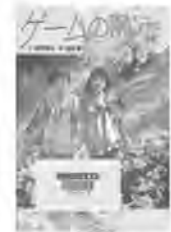
ゲームの魔法 藤野恵美/作 アリス館