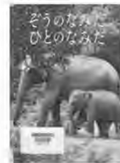
そうのなみだひとのなみだ 藤原幸一/著 アリス館