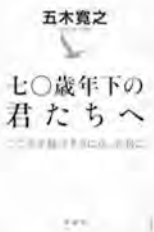
七〇歳年下の君たちへ 五木寛之/著 新潮社