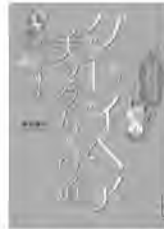
「グレイヘア」 美マダムへの道 朝倉真弓/著 小学館