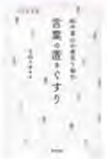
「言葉」の置きぐすり 寺田スガキ/著 東邦出版