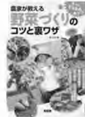
農家が教える 野菜づくりのコツと裏ワザ 農山漁村文化協会/編 農山漁村文化協会