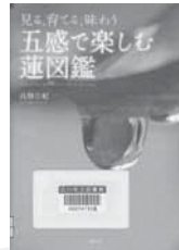
見る、育てる、味わう五感で楽しむ運図鑑 高畑 公紀/著 淡文社