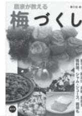
農家が教える梅づくり 農文協/編 農山漁村文化協