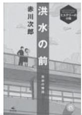
洪水の前 赤川 次郎/著 汐文社