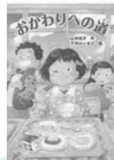
おかわりへの道 山本 悦子/作 PHP 研究所