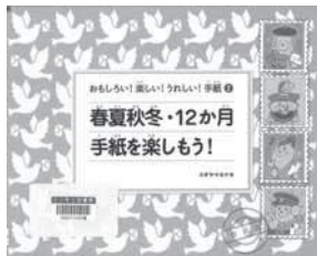
おもしろい!楽しい!うれしい!手紙2 スギヤマ カノヨ/著 偕成社