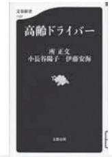
高齢ドライバー 所 正文/著 文藝春秋