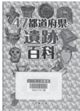
47 都道府県・遺跡百科 石神 裕之/著 丸善出版