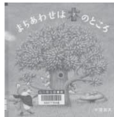
まちあわせは木のところ 牛窪 良太/作 白泉社