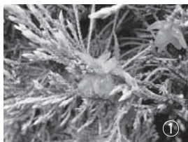
①カイツカイブキに付着した赤星病菌