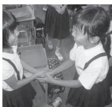
ソーシャルスキルトレーニング