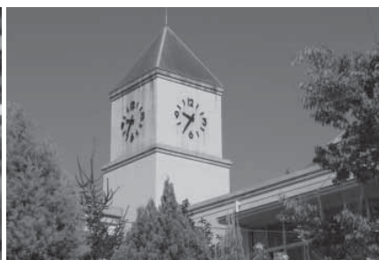
(上)トレードマークの時計台 (左)サスケサーキット (右)校章