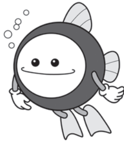
下水道のマスコットキャラクター「スイスイ」

都市計画下水道（案）に対して意見がある場合は、意見書をご提出ください。提出された意見の要旨は、町都市計画審議会へ提出されます。