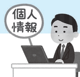
公文書・個人情報開示請求状況