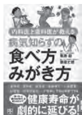
内科医と歯科医が教える 病気知らずの食べ方がき方 栗原毅 / 監修 日東書院本社