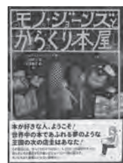
モノ・ジョーンズと からくり本屋 シルヴィア・ビショップ / 作 フレーベル館