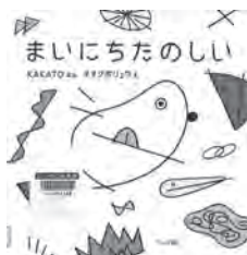
まいにちたのしい KAKATO / ぶん ブロンズ新社