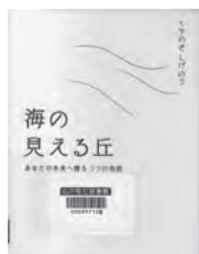
海に見える丘 くすのきしげのり / 作 星の環会