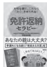
免許返納セラピー 志堂寺和則 / 監修 講談社