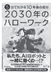
5分でわかる10年後の自分 2030年のハローワーク 関子慧 / 著 KADOKAWA