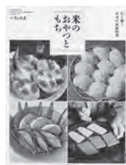
別冊うかたま 米のおやつともち 農山漁村文化協会