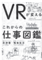
VRが変える これからの仕事図鑑 赤津慧 / 著 光文社