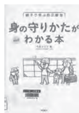
親子で学ぶ防災教室 身の守りかたがわかる本 今泉マユ子 / 著 理論社