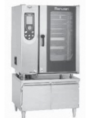
スチームコンベクションオープン

望に添えるべく、厨房機器の高い品質や安全性はもろろのこと、価格や納期の面も重視。最新鋭の自動化生産設備を導入して多品種少量生産体制を充実させたり、特注製品の生産に積極的に取り組んだり、さまざまな要望を“かたち”にする努力を重ねています。