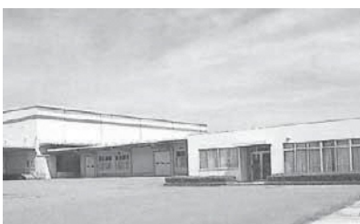
広川工場では焼海苔を生産しています

日本の食文化の素晴らしさを尊び、その新しい価値の創造を提案の柱とする基本方針は、現在も変わることなく全社内生き続けています。