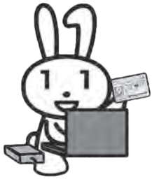
マイナンバー PRキャラクター マイナちゃん

公的な身分証明書として使える「マイナンバーカード」。交付申請はスマートフォンやパソコン、郵便などでできますが、「自撮りは難しい」「オンライン申請の方法が分からない」など、なかなか申請できない人も多かったのではないのでしょうか？