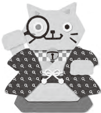
プレミアム付商品券キャラクター「カクニャン」

10月1日(火)から「広川町プレミアム付商品券」の販売が始まります。購入引換券をお持ちの方は、近隣の郵便局で購入ください。