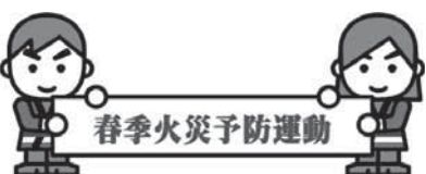
春季火災予防運動

「コンセント回りのほこりを取り除き、たこ足配線はしない」、「住宅用火災警報器をまだ設置していない家庭は設置する」など、家庭でできることから行いましょう。