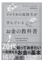
アメリカの高校生が学んでいる お金の教科書 アンドリュー・O・スミス / 著 SBクリエイティブ