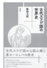
古代スラヴ語の世界史 服部文昭 / 著 白水社