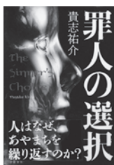
罪人の選択 貴志祐介 / 著 文藝春秋