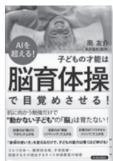
子どもの才能は 「脳育体操」で目覚めさせる! 南友介 / 著 青春出版社