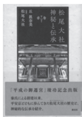
松尾大社 神秘と伝承 丘眞奈美 / 著 淡文社