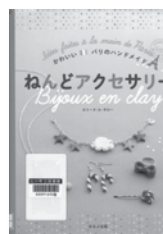
ねんどアクセサリ カリス・ル・ギロー / 著 ほるぷ出版