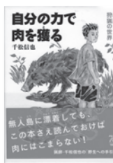
自分の力で肉を獲る 千松信也 / 著 旬報社