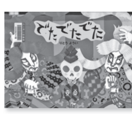
てたてたてた りとうい / 作 絵本館