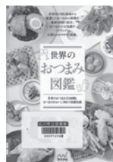
世界のおつまみ図鑑 マイナビ出版