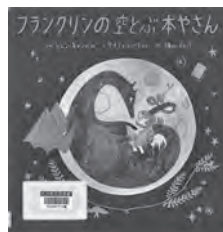
フランクリンの空とぶ本やさん ジェン・キャンベル / ぶん BL 出版