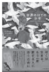
世界のはての少年 ジェラルディン・マコックラン / 著 東京創元社