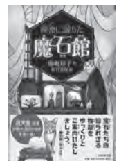
秘密に満ちた魔石館 廣嶋玲子 / 作 PHP 研究所