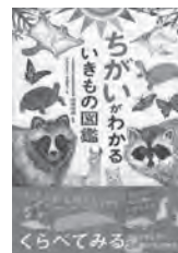
ちがいがわかるいきもの図鑑 成島悦雄 / 監修 高橋書店