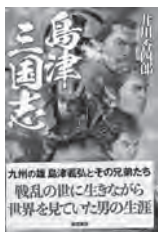
島津三国志 井川香四郎 / 著 徳間書店