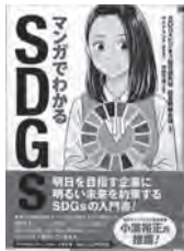
マンガでわかる SDGs SDGs ビジネス総合研究所経営戦略会議 / 監修 PHP エディターズ・グループ