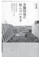
芝園団地に住んでいます 大島隆 / 著 明石書店