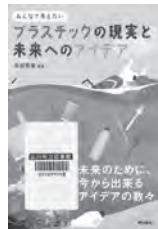
プラスチックの現実と未来へのアイデア 高田秀重 / 監修 東京書籍