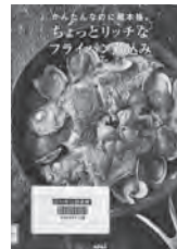
ちょっとリッチなフライパン煮込み 川上文代 / 著 東京書店