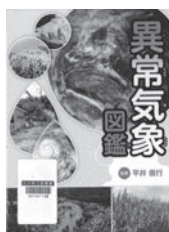
異常気象図鑑 平井信行/監修 金の星社