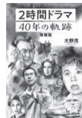
2時間ドラマ 40年の軌跡 大野茂/著 東京ニュース通信社