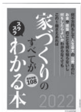
家づくりのすべてがスラスラわかる本 2022 エクスナレッジ