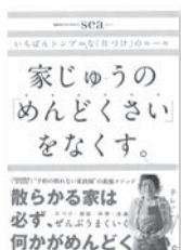
家じゅうの「めんどくさい」をなくす。 sea/著 ダイヤモンド社