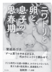
ニワトリと卵と息子の思春期 繁延あづさ/著 婦人之友社