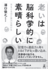
老いは脳科学的に素晴らしい 澤口俊之/著 幻冬舎