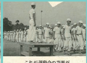
これが運動会の花形だ