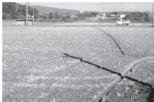
熊野神社や坂東寺に縁の地（智徳区） 中央に白くガードレールが見えるのが「うすい橋」。かつてこの地に御神体あるいは御本尊を白の上に安地したことに因む地名で、現在なお有水（うすい）の字地名が残る。

現在もなお智徳区内の小字として、有水という地名が残つて、その歴史の名残りを留めているのです。