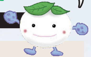
広川中学校マスコットキャラクター ひろっぱちゃん