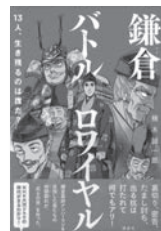
鎌倉バトルロワイヤル 楠木誠一郎/著 講談社