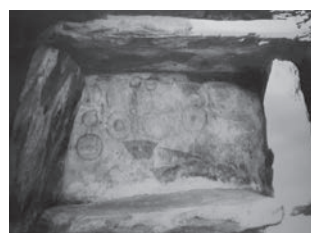
▲弘化谷古墳の壁画

ていただく点にあります。現在、資料館では映像で古墳内の壁画を見ていただいておりますが、石室内の温湿度も安定し、カビなどの発生もなく公開できる日を心待ちにしています。その他の古墳外観が楽しめるものや、丘陵斜面の横穴墓などは公開されています。