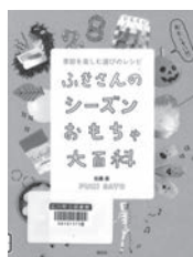
ふきさんのシーズンおもちゃ大百科 佐藤藤/著 倍成社