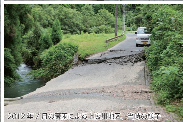
2012年7月の豪雨による上広川地区、当時の様子

避難行動の支援を必要とする人は、福祉課高齢者支援係(☎0943-32-1113)へご相談ください。