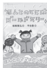
ほんとのママはゴールドマリー 板橋雅弘/作 岩崎書店