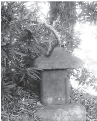
千人塚・八幡菩薩塔 八女丘陵上に残る千人塚（供養塔）で八幡菩薩とあわせ刻まれる。この一帯で度々戦があったことの名残りと考えられる。

これまで述べてきたように、太田清水の戦（1336年2月）、豊福原・六段河原の戦（1336年8月）、第二次豊福原の戦（1337年5月）、第三次豊福原の戦（1340年7月）と、4回にわたって豊福丘陵から広川沿いが主戦場となりました。このことは、この一帯が、戦略的にいかに要衝の地であったかの証左です。