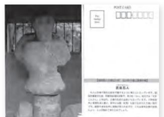
▲武装石人のポストカード

当資料館では4月10日(日)に予定していた弘化谷古墳の一般公開を中止する代わりに、来館記念品として希望者へ武装石人や石棺など4種類のオリジナルポストカードをお渡しします。当日は壁画の説明DVDも上映しますので、ぜひお越しください。