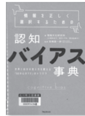
情報を正しく選択するための認知バイアス事典