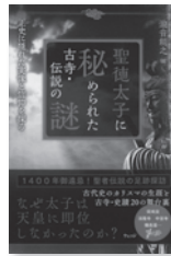
聖徳太子に秘められた古寺・伝説の謎