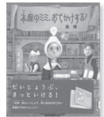
本屋のミミ、おでかけする!