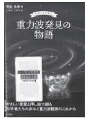
重力波発見の物語