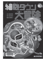
細胞タウン大冒険