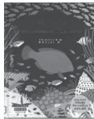
アルバ うつくしうみをまもった100さいのさかな