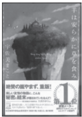
羊は安らかに草を食む