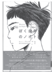
ぼく自身のノオト