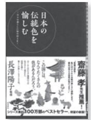
日本の伝統色を愉しむ