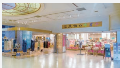
地場産くるめ物産館 東合川店 久留米インターチェンジ北側 (営業時間 10時～17時) ☎ 0942-44-3700

毎月11日は 「いい日地場産の日」 11%引き で商品を販売しています (一部商品除く)