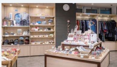
地場産くるめ物産館 六ツ門店 久留米シティプラザ南側六ツ門商店街内 (営業時間 10時～18時) ☎ 0942-36-0006