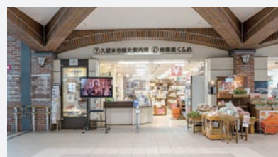
地場産くるめ物産館 JR 久留米駅店 JR 久留米駅 2階新幹線改札前 (営業時間 8時～19時) ☎ 0942-27-5510