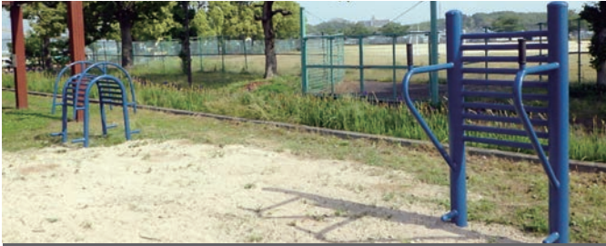
広川町運動公園（写真上）、藤田運動公園（写真下）