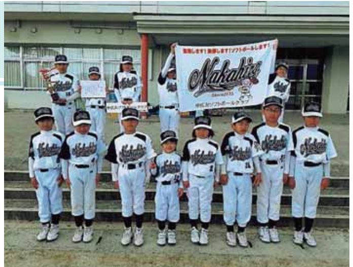
夏季は水・土曜日、冬季は土・日曜日に、中広川小学校のグラウンドで練習しています！