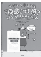
子どもを守る言葉「同意」って何? レイチェル・プライアン / 作 集英社