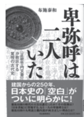
卑弥呼は二人いた 布施泰和 / 著 河出書房新社