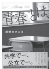
青春とは、 姫野カオルコ / 著 文藝春秋