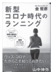
新型コロナ時代のランニング 金哲彦 / 著 KADOKAWA