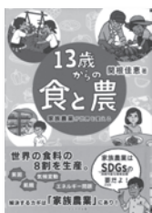
13歳からの食と農 関根佳恵 / 著 かがわ出版