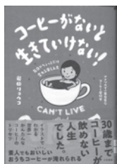
コーヒーがないと生きていけない! 岩田リョウコ / 著 大和書房