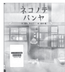
ネコノテパンヤ 高木さんご / 作 ひさかたチャイルド