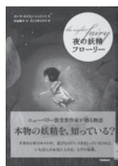
夜の妖精フローリー ローラ・エイミー・シュリッツ / 作 学研プラス