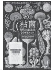
粘菌 ジャスパー・シャープ/著 誠文堂新光社