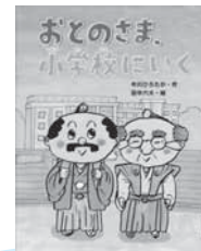
おとのさま、小学校にいく 中川 ひろたか/作 佼成出版社