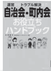
運営からトラブル解決まで自治会・町内会お役立ちハンドブック 水津 陽子/著 有楽出版社