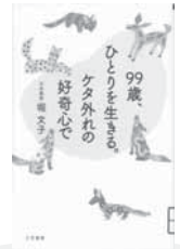
99歳、ひとりを生きる。ケタ外れの好奇心で 堀 文子/著 三笠書房