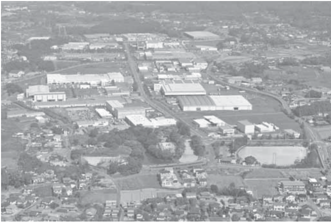
広川中核工業団地