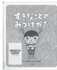
すきなことのみつけかた たかい よしかず/さく 大日本図書