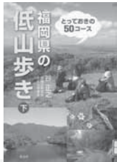
福岡県の低山歩き 下 谷 正之/著 海鳥社