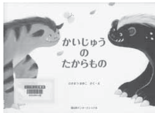
かいじゅうのたからもの ひさまつ まゆこ/さく・え 富山房インターナショナル