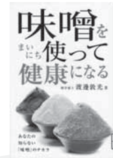
味噌をまいにち使って健康になる 渡邊 敦光/著 キクロス出版