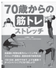
70歳からの筋トレ&ストレッチ 大淵 修一/編著 法研