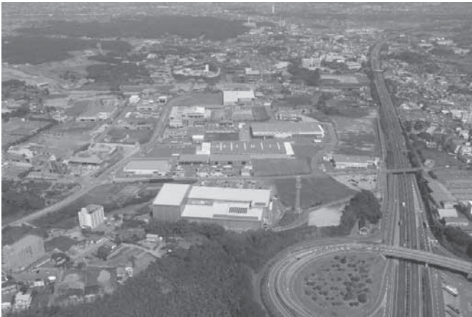
久留米・広川新産業団地