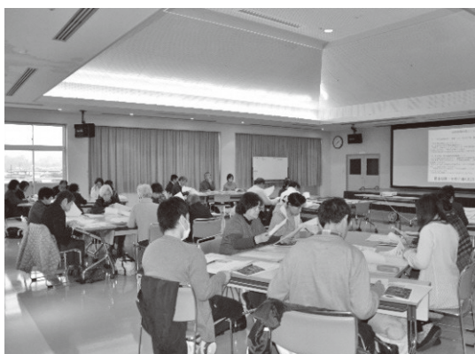
登録団体更新説明会・情報交換会