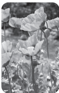
ケシの一種、ソム ニフェルム

違法と知らず、住宅の庭先 などにケシが植えられている ことがあります。見つけた人 は南筑後保健福祉環境事務所 や最寄りの警察署へご連絡く ださい。