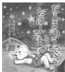
だんまりうさぎと おほしさま 安房 直子/著 偕成社