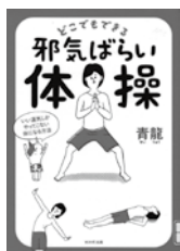
どこでもできる 邪気ばらい体操 青龍/著 WAVE出版