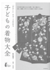
子どもの着物大全 似内 恵子/著 誠文堂新光社