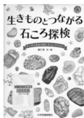
生きものをつながる 石ころ探検 盛口 満/文・絵 少年写真新聞社