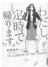
わたし、定時に帰ります。 朱野 陽子/著 新潮社