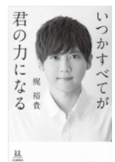
いつかすべてが 君の力になる 梶 裕貴/著 河出書房新社