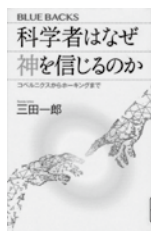
科学者はなぜ 神を信じるのか 三田 一郎/著 講談社