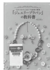
『ジュエリープラン』の 教科書 NanaAkua /著 講談社