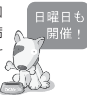
平成 30 年度新規登録・集団注射日程

※犬を制御できる人が連れて来てください。 ※逃走や事故を防ぎ、円滑な接種をするために、 首輪をしっかり装着してください。 ※犬のフンは、ビニール袋などで必ず持ち帰りください。