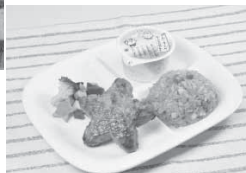
▼星形のハンバーグ（盛り付け例）

ゲンを含む原材料を持ち込まないため、誤って商品に混入することはありません。また、最後にアレルギー検査を行うことで、より安全・安心な商品を外食産業や学校給食などへお届けしています。