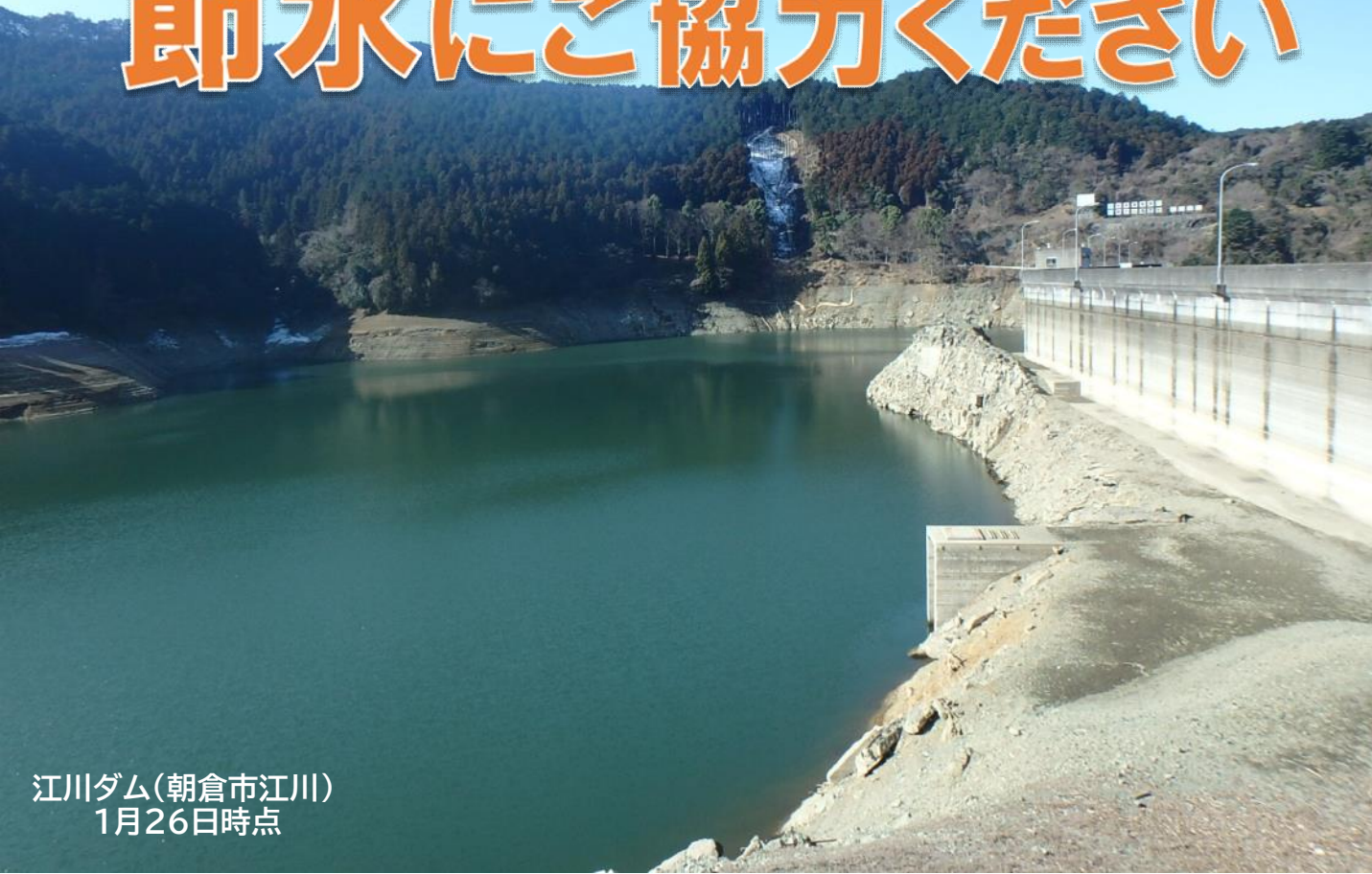
江川ダム(朝倉市江川) 1月26日時点

福岡県南地域の水道水の主な水源である筑後川は、昨年9月以降の少雨によって渇水状況が長期化・深刻化し、 筑後川上流ダム群の貯水量は残り僅か になっております。