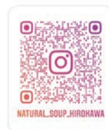
ナチュラル・スープ