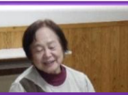
『くどうなおこ詩集〇』