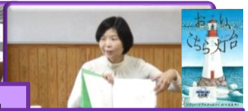
『おーい、こちら灯台』