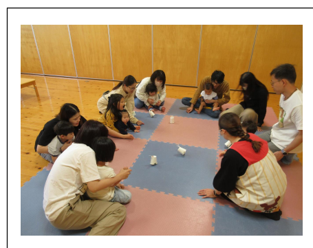
《『トコトコうさぎ』を作ろう》10日(日)・18日(月)・21日(木)

紙コップやペットボトルのキャップ等 身近な材料を使って 動くおもちゃを作りました。