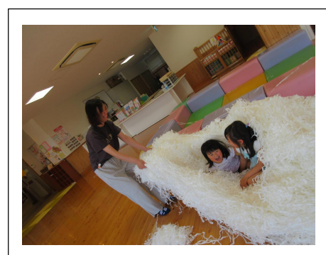
紙廃材であそぼう

セロファンを貼った紙筒に 暗い部屋でライトをつけると… 色とりどりの影絵あそびを 楽しみました。