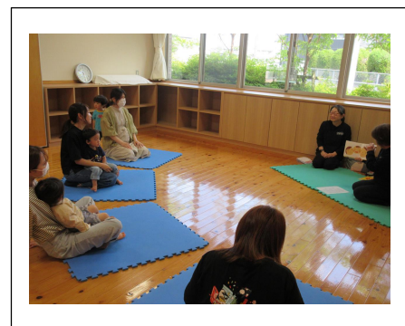
《かっちゃんのおはなし会》13日(水)

お子さまを負荷にして 音楽に合わせたリズム運動。 ママの筋力アップを目指します。