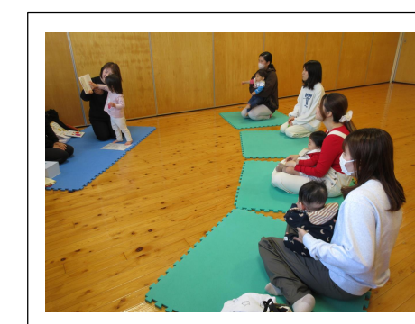
《かっちゃんのおはなし会》8日(水)

シフォンをかぶって・・・ 「おばけだぞ～」 たくさんの方に 参加していただきました。