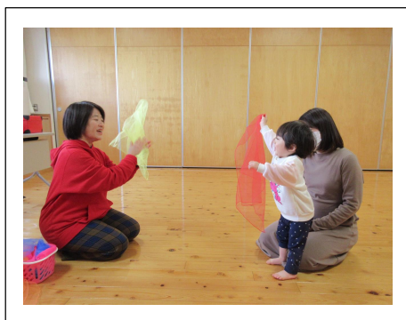
《音楽遊び♪》6日(月)・26日(日)