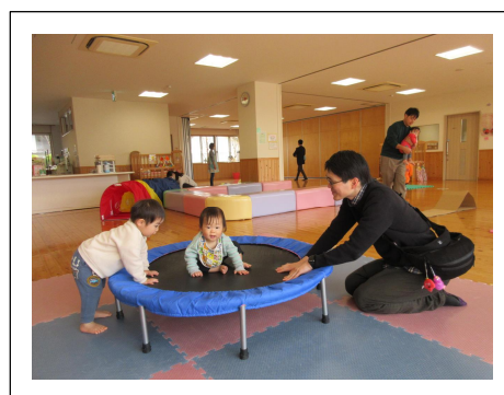
《体を動かしてあそぼう》5日(日)