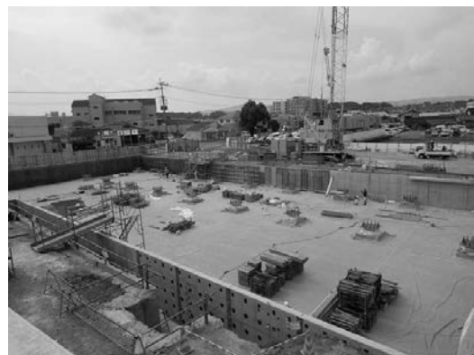
新庁舎建設の状況(6月末現在)