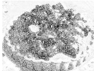
人気の高い返礼品