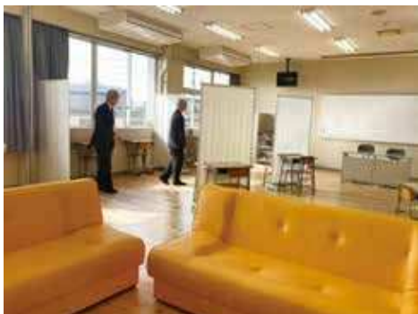
教育支援センター