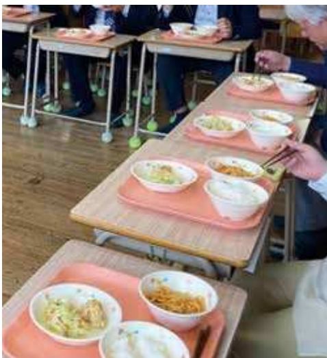
給食試食会の様子