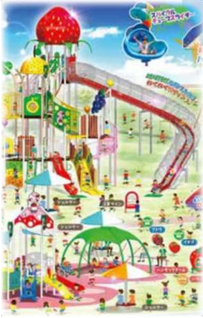
遊具完成イメージ図

現在、駐車場整備、トイレなど完成しています。 今後、遊具の設置を進め、令和8年11月のプレオープンを目指します。