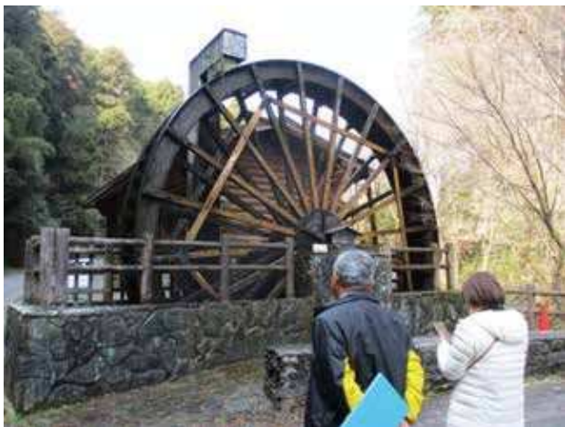
ゴットン館の水車