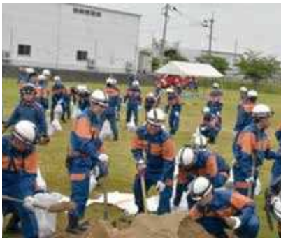
水防訓練（土のう作り）