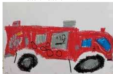
斗和保育園 えさきりょうさん