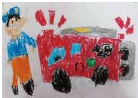
斗和保育園 つつみ おとはさん