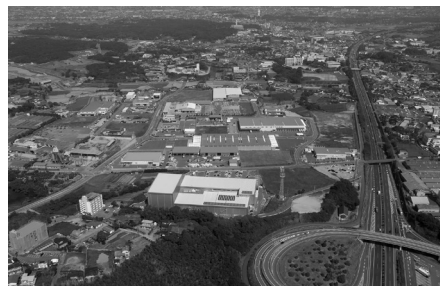
地域企業の可能性を広げる