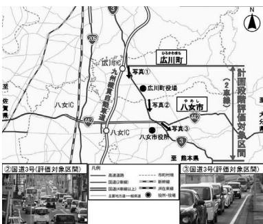
国道3号バイパス推進