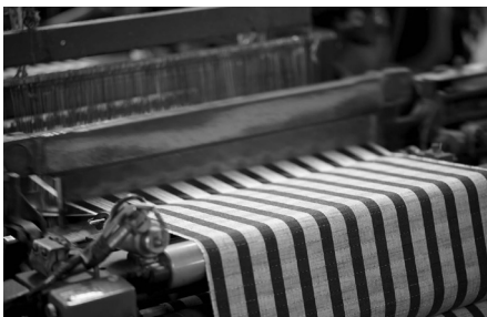
地域産業の可能性を広げる