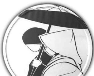
結婚サポートセンター 出会いの場と結婚