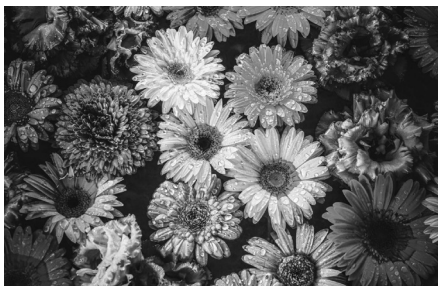
地域資源から新たな資源を生み出す