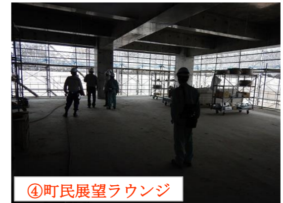
④町民展望ラウンジ