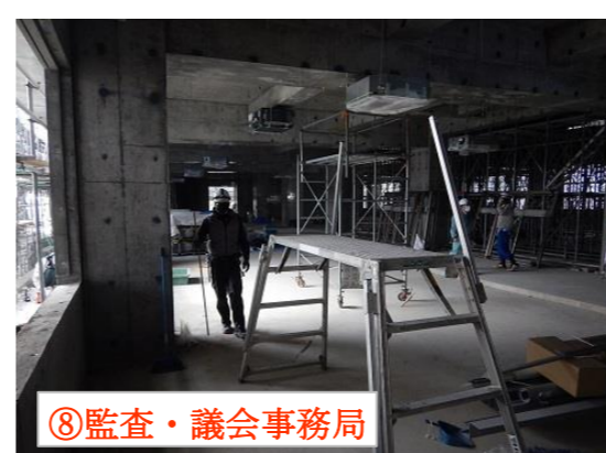
⑧監査・議会事務局