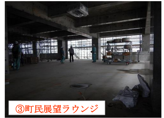
③町民展望ラウンジ