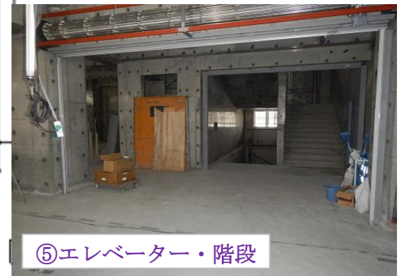
⑤エレベーター・階段