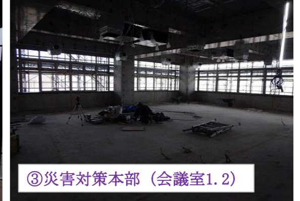
③災害対策本部 (会議室1,2)