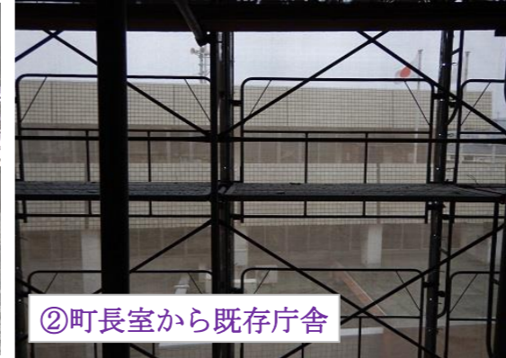
②町長室から既存庁舎