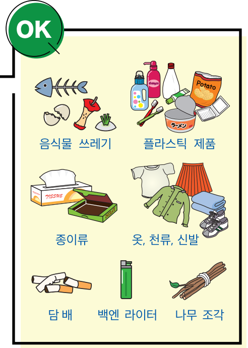
← 지정된 쓰레기 봉투