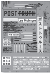
ポストトゥルース リー・マッキンタイア / 著 人文書院