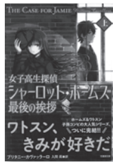
女子高生探偵 シャーロット・ホームズ最後の挨拶 フリタニー・カヴァッラーロ / 著 竹書房