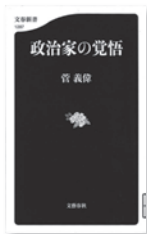
政治家の覚悟 菅義偉 / 著 文藝春秋