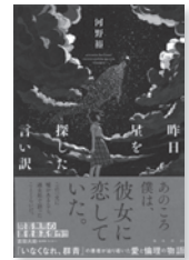
昨日星を探した言い訳 河野裕 / 著 KADOKAWA