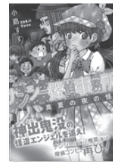
ナンシー探偵事務所 2 小路すず / 作 岩崎書店