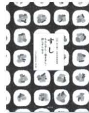
全集伝え継ぐ 日本の家庭料理 3 日本調理科学会 / 企画・編集 農山漁村文化協会