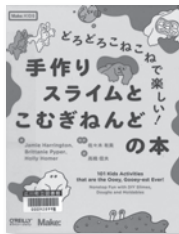
手作りスライムと こむぎねんどの本 Jamie Harrington / 著 オライリー・ジャパン