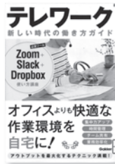
テレワーク 新しい時代の働き方ガイド 学研プラス