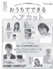
おうちでできる ヘアカット 主婦の友社 / 編 主婦の友社