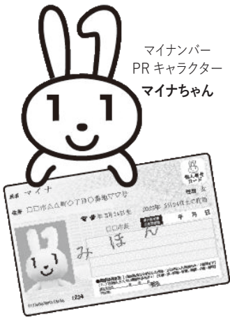
マイナンバー PRキャラクター マイナちゃん

まだマイナンバーカード（個人番号カード）をお持ちでない人へ、12月～3月、QRコード付きの「個人番号カード交付申請書」が送付されます。