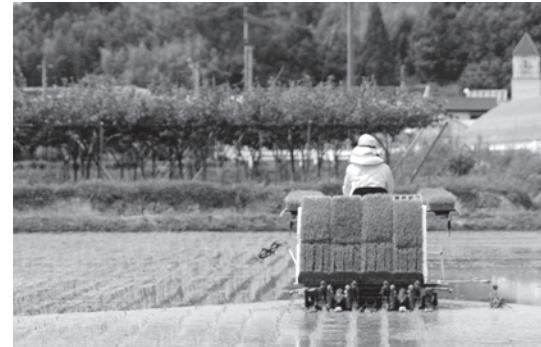
小型特殊自動車の種類と税額