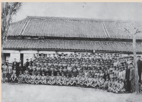
▲青年学校の訓練（中広川村）

昭和16年（1941年）3月1日、「国民学校令」が公布され、4月1日から従前の尋常高等小学校は、国民学校と改称されました。