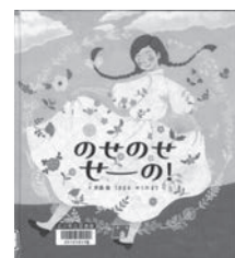
のせのせせーの! 斉藤倫・うきまる / 文 ブロンズ新社