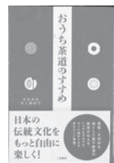
おうち茶道のすすめ 水上麻由子 / 著 二見書房