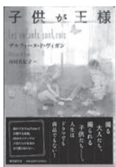
子供が王様 デルイス・ド・ガイガン / 著 東京創元社