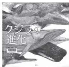
クジラの進化 水口博也 / 文 講談社