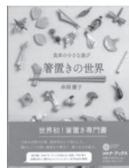
箸置きの世界 申岡慶子 / 著 平凡社