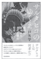
サルタヒコのゆくえん 戸矢学 / 著 河出書房新社