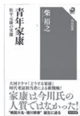
青年家康 柴裕之 / 著 KADOKAWA