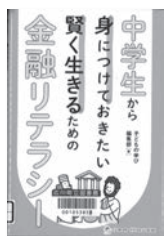
中学生から身につけておきたい 賢く生きるための金融リテラシー 子どもの学び編集部 / 著 ジャムハウス