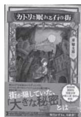
カトリと眠れる石の街 東暉太郎 / 著 講談社